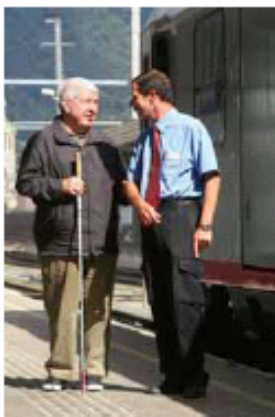
Bild oben: Persönliche Betreuung auch für Menschen mit Sehbehinderung

Auch beim Postbus werden in den kommenden Jahren verstärkt Niederflrbusse und Überlandbusse mit Hebeliften angeschafft. Im Fernverkehr kommt ab 2008 der railjet zum Einsatz, der über fahrzeuggebundenen Hebelifte und taktile Elemente im Zug verfügt.