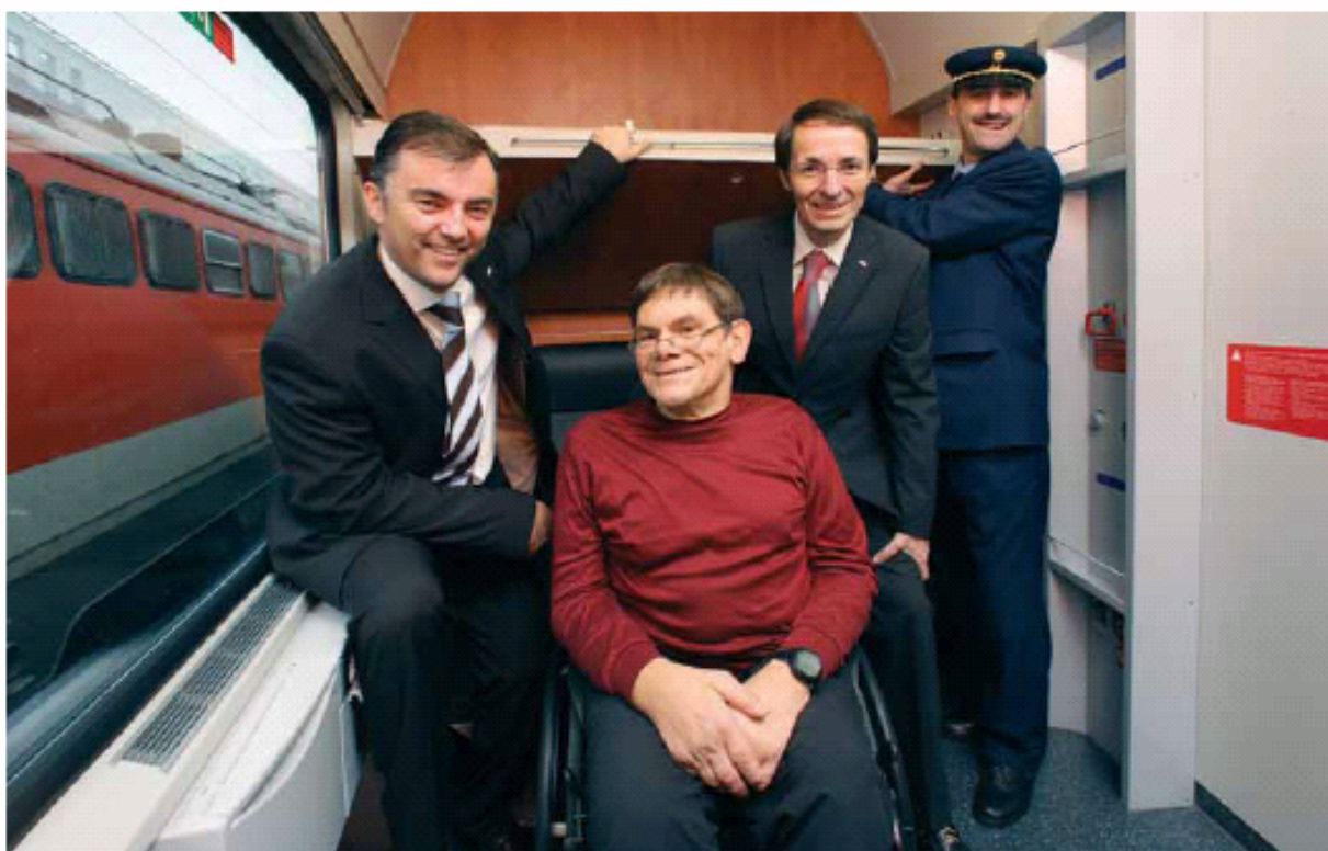
Barrierefrei gestaltetes Komfortabteil